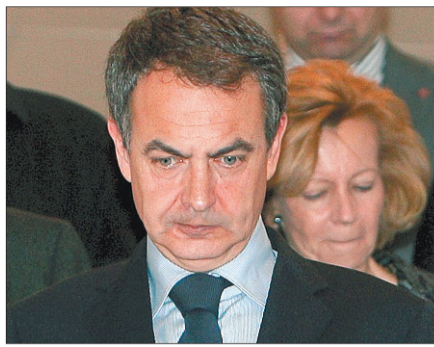
Rodríguez Zapatero y Salgado.