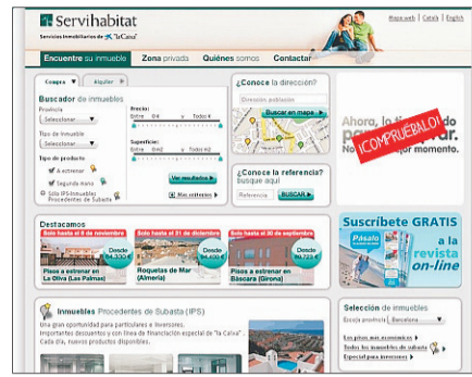
Portal del web de Servihabitat.