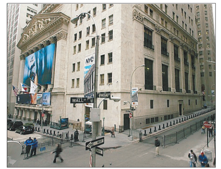
Bolsa de Nueva York, en Wall Street.