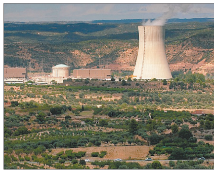
El debate nuclear sigue sin resolver.